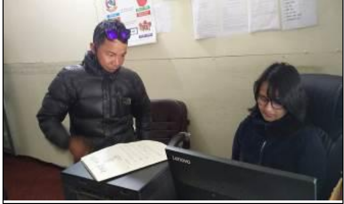
गाउँपालिकामा राजस्व संकलन गरिँदै