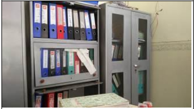
गाउँपालिकामा राजस्वसम्बन्धी भौचर र सम्बन्धित कागजपत्रको फाइलिङ पद्धति